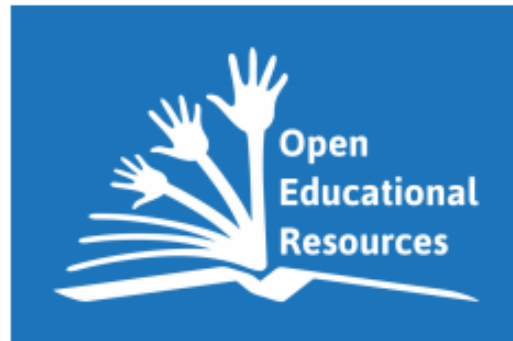
OER Global Logo by Jonathas Mello, CC BY. The open hands stand for the collaboration and collective knowledge involved in OER practices.

لوگوی جهانی OER که دستان باز نشان از دانش مشارکتی و تجمعی در فعالیتهای مختلف آموزشی است.