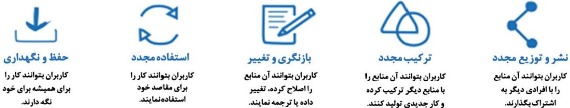
حفظ و نگهداری کاربران بتوانند کار را برای همیشه برای خود نگه دارند.

کاربران بتوانند آن منابع را با افرادی دیگر به اشتراک بگذارند.