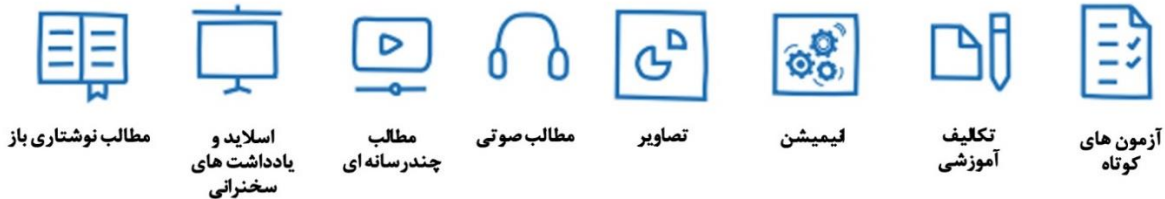
مطالب نوشتاری باز