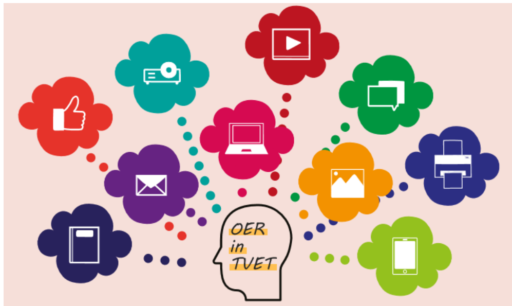
منابع آموزشی باز در آموزش‌های فنی و حرفه‌ای